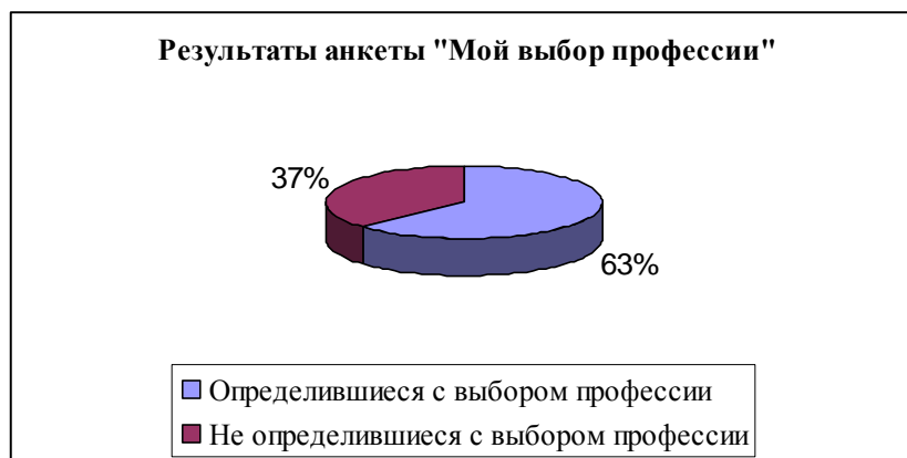
Рис.1. Результаты анкеты «Мой выбор профессии»

После обработки результатов было выявлено, что 10 человек, на данный момент, не смогли определиться с выбором профессии (Рисунок 1).