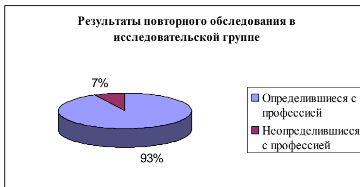
Рис.5. Результаты повторного обследования в исследовательской группе

Мы заметили, что старшие подростки стали значительно активнее, было видно, что предложенные вопросы и задания уже знакомы старшим подросткам, и отвечать на них им было значительно легче, чем при первичном обследовании.