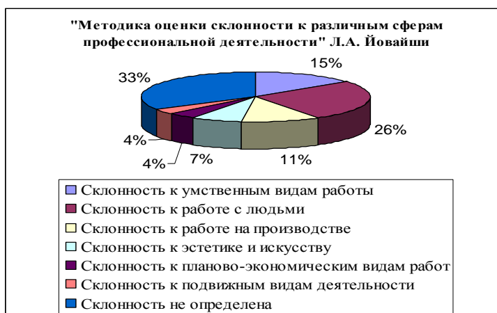
Рис.4. Результаты первичной диагностики методики «Методика оценки склонности к различным сферам профессиональной деятельности» Л.А. Йовайши

Далее представлены результаты в процентном соотношении, составленные при первичной диагностики методики «Методика оценки склонности к различным сферам профессиональной деятельности» Л.А. Йовайши (Рисунок 4).