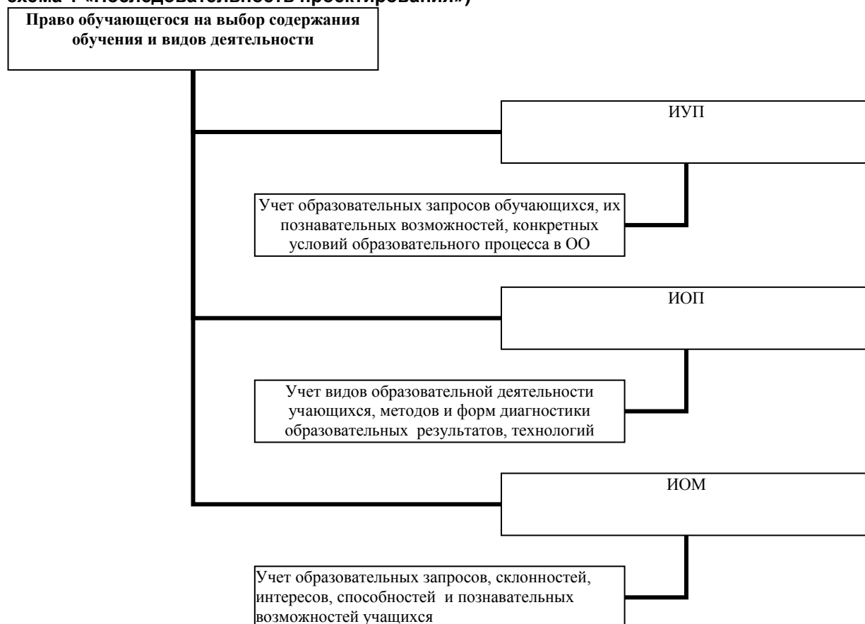
схема 1 «Последовательность проектирования»

Индивидуализация процесса обучения предполагает формирование индивидуальных учебных планов (ИУП) и индивидуальных образовательных программ (ИОП) , что в итоге позволяет сформировать индивидуальный образовательный маршрут (ИОМ) учащегося.